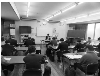
税務調査の事前対策と確認ポイントについて説明を受けた