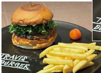
チーズ好きにはこれ! モッツアレラチーズバーガー チーズのコクが違います 1500円

人気NO.2! チーズと卵の コクがたまらない! イタリアンテイストカルボナーラバーガー 1900円