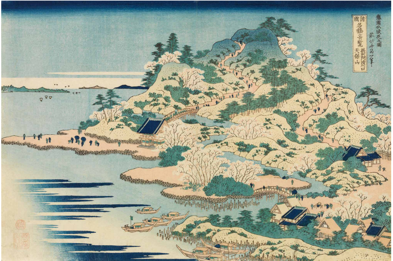
すみだ 北斎美術館蔵