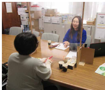
1対1でたっぷり1時間 相談できます