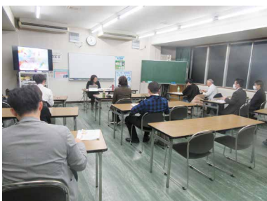
熱心に受講する参加者

第10回目は、「労務トラブル事例と社労士の活用」で①労務トラブル訴訟事例②社労士の活用法等について大田社会保険労務士が解説した。