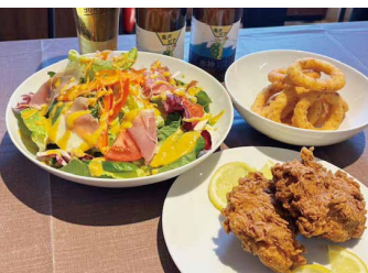
大人気トラヴィスサラダ 1200円。レタスの下にトルティーアが隠れている。フライドチキン1P 360円、オニオンリング650円

その他、サイドメニューで「オニオンリング」や「フライドチキン」も人気があり、ドリンクメニューも豊富で、こだわりのコーヒーマシンの類の他、「クラフトビール」などのアルコール類や「黒蜜きなこシェイク」や「チョコバナナシェイク」などのシェイクも大人気だ。