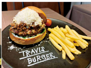
人気NO.1! イタリアンテイスト ポロネーゼバーガー 1900円