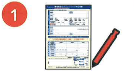
電気の検針票イメージ▶