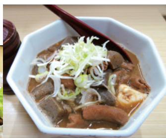
激ウマ! みそ味「にこみ」500円

が盛られた上に鰹節がかかった「新玉ねぎしらすサラダ」や、「カレーコロッケ」、「メンチカツ」などなど。特におすすめは店自慢の「にこみ」と「焼き豚」とのこと。