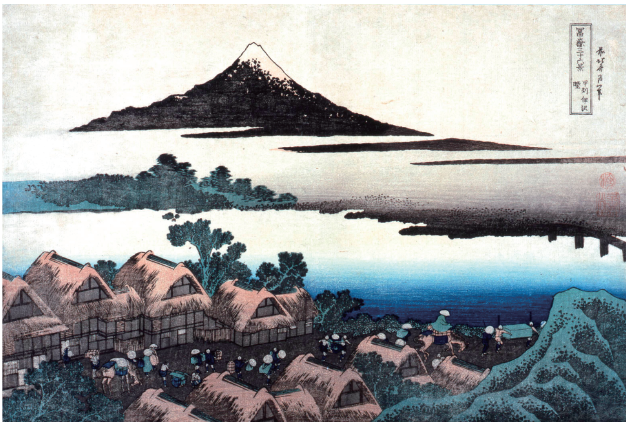
す み だ 北 斎 美 術 館 蔵