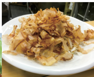
大盛りの鰹節に圧巻「新玉ねぎしらすサラダ」550円

夜の人気のお品を伺うと、「お刺身」や「天ぷら」の他、クリーミーな「ポテトサラダ」、新玉ねぎ・しらす・温泉玉子