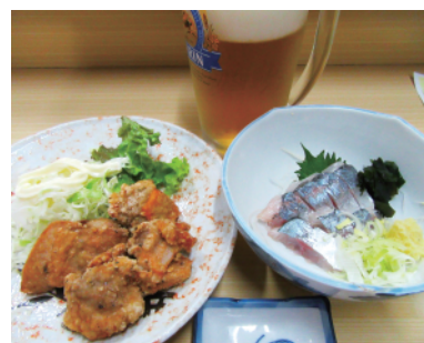
「伊勢元晩酌セット」1,250円

その他、ちよこつと一杯だけという方には「伊勢元晩酌セット」があり、生ビールの小ジョッキか中ジョッキにお料理2品が付いて各1050円/1250円。また一品料理に250円プラスすると定食セットにしてくれる。冬季には、「つくね鍋」や「キ