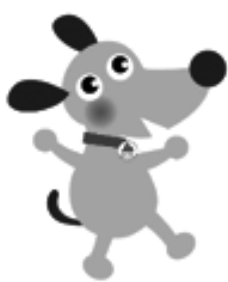
法人会キャラクター「けんた」

行政の効率化や利便性の向上、国民の社会保障や税の給付と負担の公平性と透明性を実現する等メリットは大きいですが、個人情報流出や悪用への対応や費用対効果が課題となる。個人情報の管理に万全を期し、コストの明確化により、国民の納得と理解を得ながら推進するよう求める。