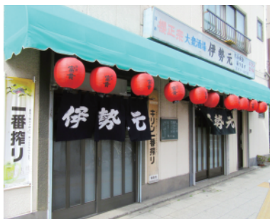
目を引く伊勢元さん入口

お店は京葉道路沿い、亀戸9丁目歩道橋のたもと、5差路交差点の角にある。JR「亀戸」駅東口から15分、都バス「亀戸9丁目」からは徒歩1分となる。立地を生かしたV字型の建