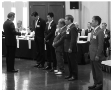
会員増強目標達成支部表彰

の税務に関する各種研修会・説明会など公益目的事業や新年賀詞交歓会や会員大会など、会員の交流事業などの実施。また、決算報告では、経常収益3千79万5千円、経常費用3千789万3千円からなる決算額をそれぞれ承認。