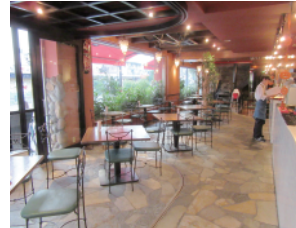
明るく広い店内 奥にはソファ席もある

店内は通りに面して広く親子張りになっていて解放感があり明るく、夜は流れる車のライトを眺めて食事ができる。席は4人掛けのテーブルが並び66名まで入れる。お昼はコーヒーお替り自由