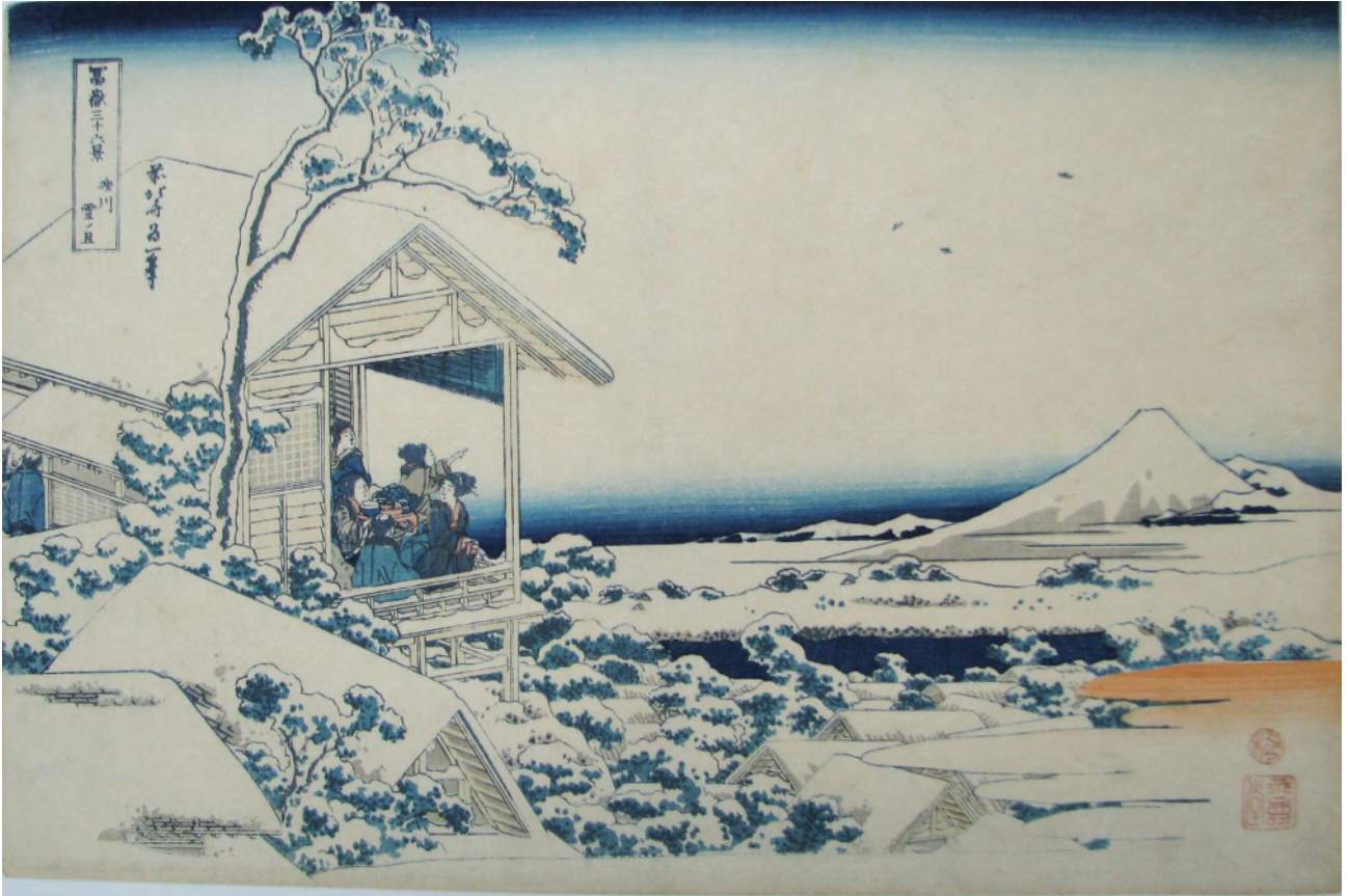
すみだ北斎美術館蔵