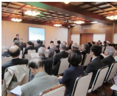
聴取者で一杯の講演会

続いて、日本の財政の現状について、歳入と歳出、一般会計税収、歳出総額及び公債発行額の推移、税収の推移、公債残高の推移等について説明された。