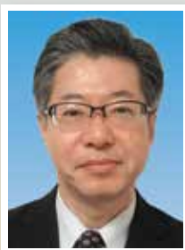
江東東税務署 署長 金子明弘