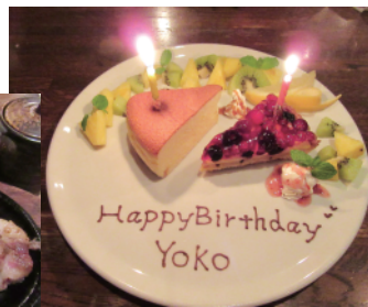
フルーツたっぷり ドルチェプレート(要予約)

あり、和牛の「すき焼き」や「しゃぶしゃぶ」が1人前から注文できるのも嬉しい。コースメニューもあり、素敵なドルチェプレートやサプライズ演出も相談に応じてくれるので、お子様のお祝い事はもちろん、カップルでもグループでも思い出に残る時間を過ごせそうだ。