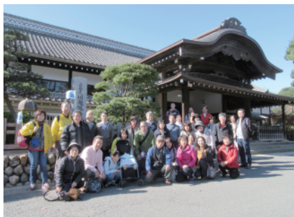
川越城本丸御殿前にてハイ！チーズ

途中、徳川家とゆかりも深く、建物の多くが重要文化財に指定されている「喜多院」に入館。その他、川越のお不動さまとして親しまれている「成田山川越別院」や「川越城本丸御殿」、約390年もの間、