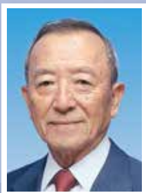
江東区長 山崎孝明