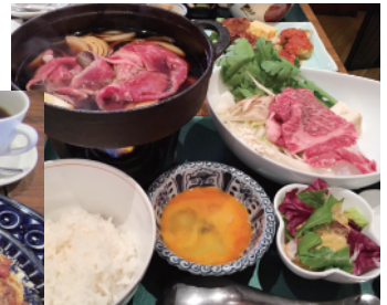
国産牛すき焼き御膳1,380円 サラダ、ご飯、お味噌汁付き

のランチセットが人気で+300円でショートケーキの中から好きな自家製ケーキが付けられる。