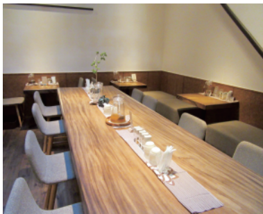
店内。天井を見るところの歴史を感じる

「味苑」は同社亀戸本店の店内一角にあり、老舗お味噌屋さんがこだわり抜いた美味しいみそ汁が味わえるイートインのお店。