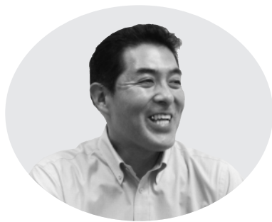
秋田 副 署 長

を長引かせて勝った戦は聞いたことがない）」孫子兵法第二編の言葉です。「巧遅は拙速に如かず」との諺に言い換えられることもあります。時と場合によりますが、常にスピードとコストパフォーマンスを意識して仕事に取り組むようにしています。