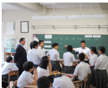
班の代表者と三輪青年部会長

東京税理士会江東東支部の税理士諸先生、江東東税務署の担当官各位の協力をいただいたことに心から感謝を申し上げます。