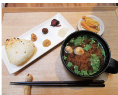
「素」のみそ汁350円と焼きおむすび250円