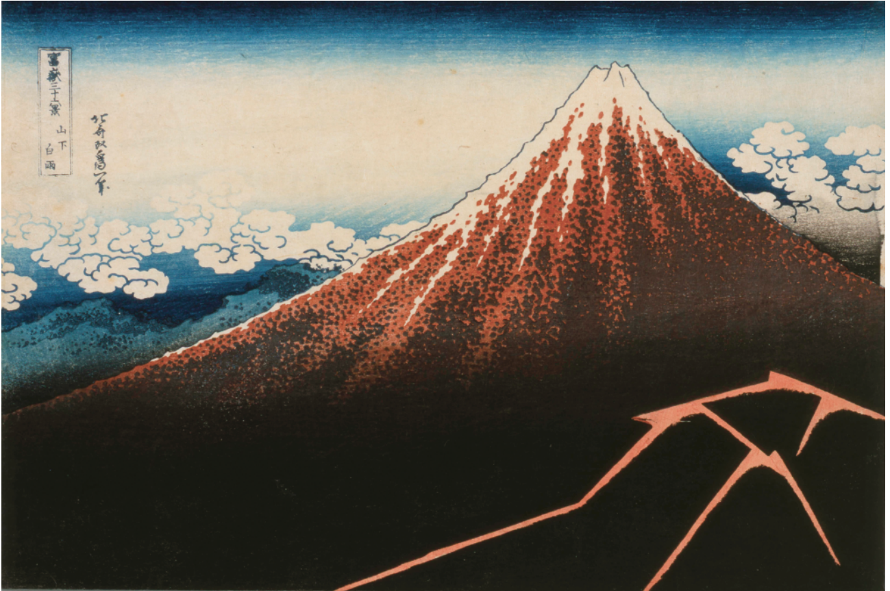
す み だ 北 斎 美 術 館 蔵