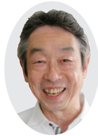
推薦の寺山支部長

当広報誌は第450号の発行となり、「支部長さんご推薦のお店」も20回目を迎えた。