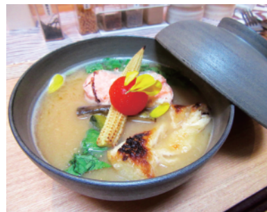
鮭、大根、茄子など8品「具」のみそ汁650円