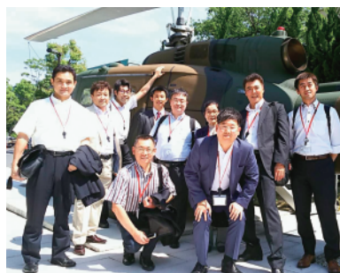
展示用ヘリの前にて

普段入ることのできない防衛省内を見学し国の安全を保つ防衛組織を学び、歴史ある資料や建造物を拝見できた貴重な研修会となった。