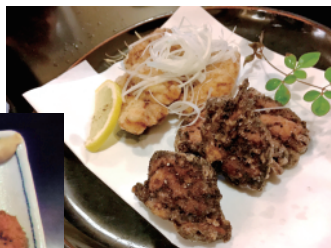
ふぐから揚げ (900円) も人気

にに応じてご相談いただきたい。常連の佐藤支部長さんが、他にお勧めしてくれたのは、新鮮なお刺身、かき揚げ天ぷら、とん串カツ。変わったところではアボガドと海老のサラダで(バケット付)。