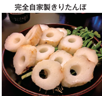
完全自家製きりたんぼ

きりたんぼは、手間をかけた完全自家製。お鍋のベースは、昆布鰹だしに地鶏と砂肝のkokが加わった逸品だ。