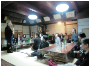
酒蔵見学で説明を受ける参加者

美人になれる?お宿自慢のお湯に浸かった後は、新鮮な海の幸を頂きながら、踊りありカラオケありの賑やかな会