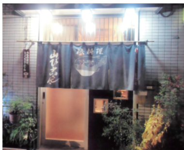
ふぐののれんが目印の入口

お店は、都バス【都07】、「亀29」「北砂二丁目」「北砂一丁目」5分、「秋26」「北砂一丁目」バス停より徒歩2分の清洲橋通り沿いの路地を入ったところにある穴場のお店だ。