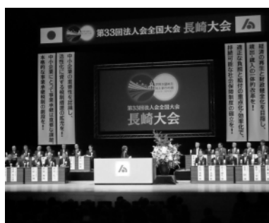
盛大に開催された全国大会

また、この提言事項の実現を図るため、全法連、県連、単位会それぞれに地元国会議員等を対象に、陳情活動を行うこととしている。