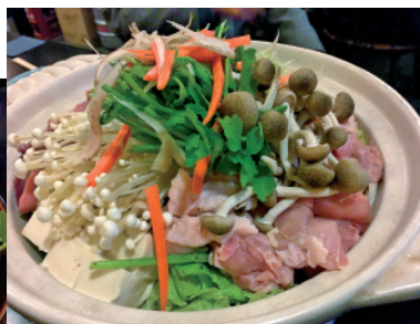
旬の野菜もたっぷり きりたんぼ鍋 (1人前1,600円)

とで、秋田出身の初代料理長が郷土料理「きりたんぼ鍋」を砂町風にアレンジし、お店の看板メニューとなっている。