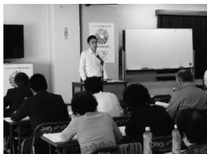
大島第1・第3支部合同研修会