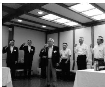
会員増強シュプレヒコール

引き続き行われた懇談会では、出店副会長の発声により威勢良くシュプレヒコールをあげ、本年度の会員増強目標数の達成を祈念した。