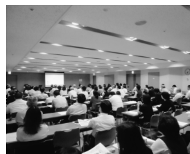
説明に聞入る参加者

が参加し、迫り来る新制度について真剣に研修を受けていた。平成28年1月から開始される同制度により、今後順次申告書や法定調書、また社会保障関係の書類を提出する際には、個人番号や法人番号の記載が必要となる。