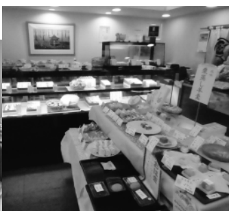
沢山のお菓子の店内

チーズを使った洋風和菓子を数々生み出している。また粒子が細かいパイウオーターを使用し、味にまろやかさを加えるなど製造工程にもこだわりを持ち、一つ一つの菓子を丹念に手作りしている。