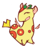
個人住民税PRキャラクター ぜいさいん