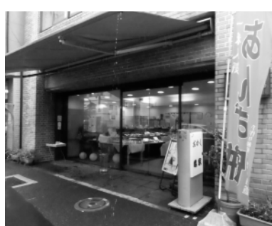
オレンジ色のノボリが目印

住所…東砂4-8-14 電話…3644-1665 時間…9時～19時 休業日 水曜日