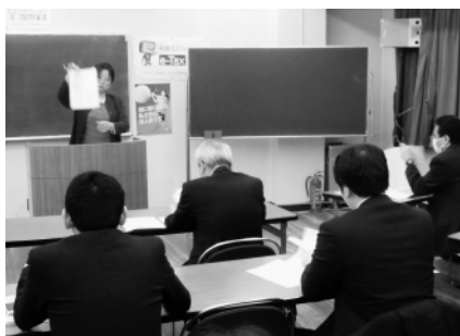
テキストを使用して研修