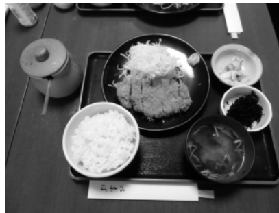
味自慢のとんかつ定食

とんかつソースは店主が厳選したメーカーから納得したものを仕入れてある。そのためお客様から「とんかつとマッチして美味しい」と評判だ。