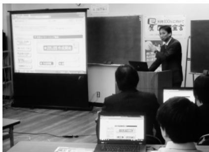
パソコンで実際に操作!