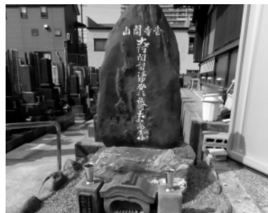
四代目市村竹之丞の寿塔

そのうち、自性院の師が老年のため江戸に帰り、老師の歿後に自性院の住職となつて衰えた寺を再興したのである。