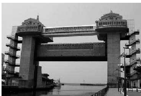
沼津港 大型展望水門「びゅうお」

国内で最大級の展望水門「びゅうお」からの360度パノラマや富士山、駿河湾の景色も眺め、沼津魚市場やマーケットモ