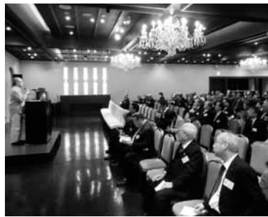
熱心に聴講する参加者

お茶のカテキンと饅頭の小麦に含まれるアントシアニンは細胞の酸化を防止する。ニューヨークで講演した時に「日本人のおばあちゃん方はなぜ美しいのか」と質問されたのでそれは和食にあると回答した。日本人はみそ汁を好む。味噌にはイソフラボン