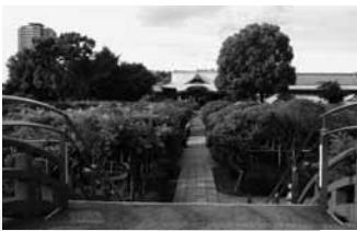
現在の 亀戸天神社

藤棚の下に江戸時代の筆塚が3基ある。境内には神牛、うその碑、塩原太助奉納の石燈籠、芭蕉の句碑や井原西鶴の歌碑、蜀山人筆跡の力石、亀井戸跡などがあつて興味深