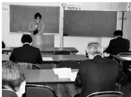
松尾上席による詳細な説明