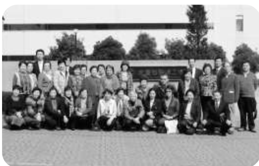
とらや御殿場工場の正面前で