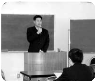
質問に答える上園上席

純資産の部の自己株式について、会社が自社の株式を取得する場合には、みなし配当が生じるケースがあるので注意が必要とのことであった。また、損益計算書は、事業