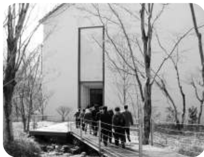
ラリック美術館へ

ここは、「ガラスの魔術師」ともいわれるフランスを代表する装飾美術工芸家ルネ・ラリックの作品を千五百点收藏し、その中から香水ビン・花器等のガラス工芸品や建築装飾など二百三十点が常設展示されている。