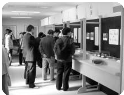
こんな器具で羊羹が作られていたんだ

手作りでの菓子を作っている東京と京都の工場に対し、ここはコンピューター制御による最新設備で、羊羹など量産物を中心に売上高の九割を生産しているという。品質管理も、材料入荷から製品の検査まで徹底しており、和菓子の老舗というイメージとはだ